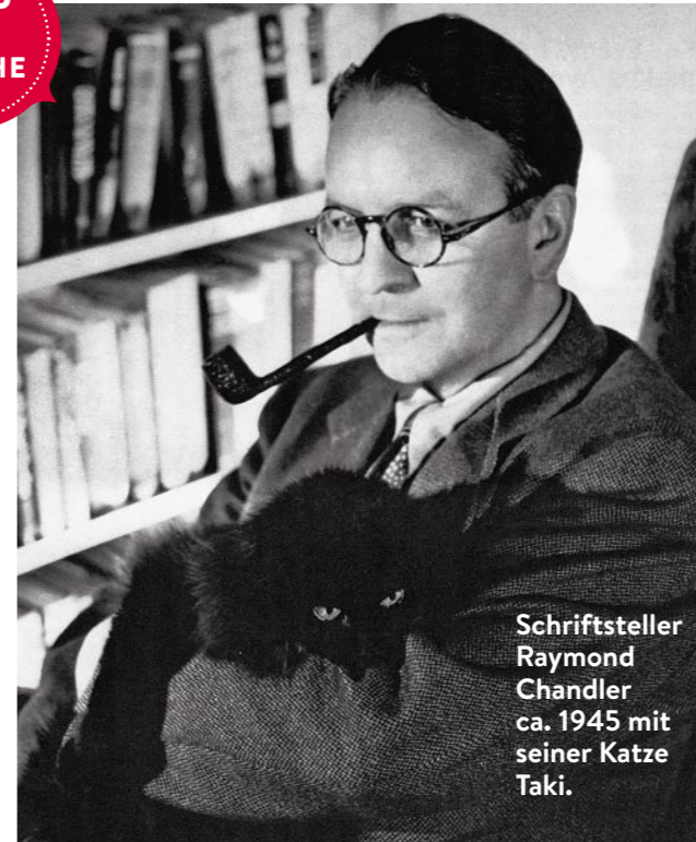
Schriftsteller Raymond Chandler ca. 1945 mit seiner Katze Taki.

In «Das hohe Fenster» konfrontiert Raymond Chandler seinen Privatdetektiv Philip Marlowe mit einer Reihe unerfreulicher Ereignisse und Menschen.