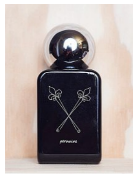
– MANSA – UNISEX-PARFÜM, 50 ML, 195 FR.